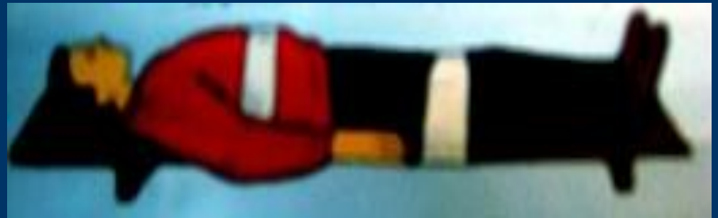
Пример иммобилизации позвоночника