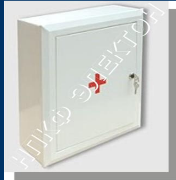
Шкаф для аптечки