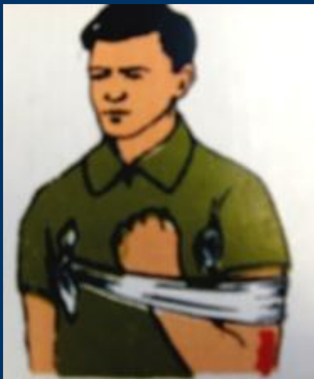
В плечевом суставе