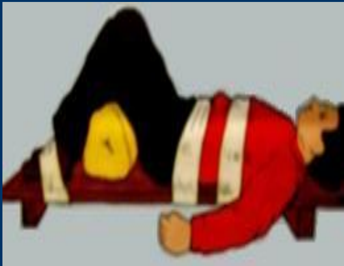
Пример иммобилизации таза