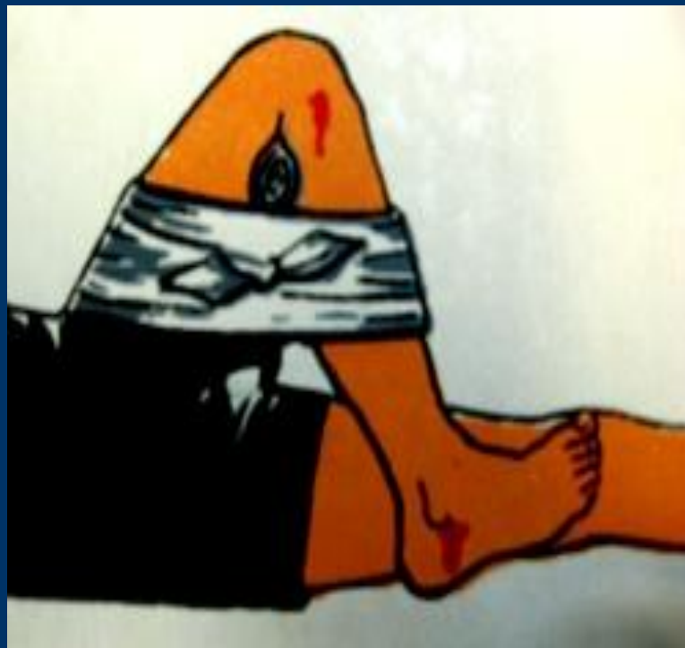
В коленном суставе